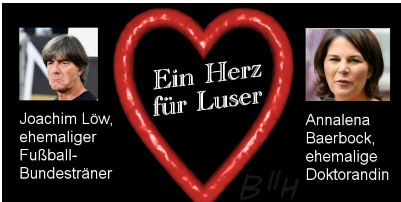
Joachim Löw, ehemaliger Fußball- Bundestrainer